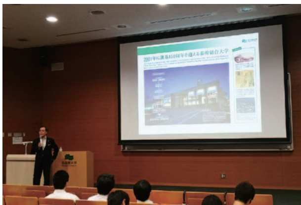
講義をする松尾総長

この講義の様態を撮影した動画を、インターネット（「名大の授業」 http://ocw.nagoya-u.jp/ ）で視聴することができます。