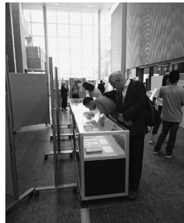
展示品を熱心に観覧する人々