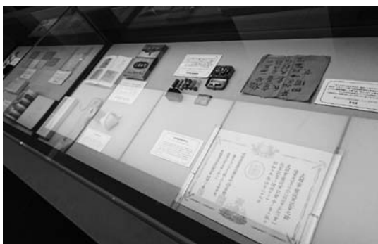
「戦場と軍医」コーナーの一部