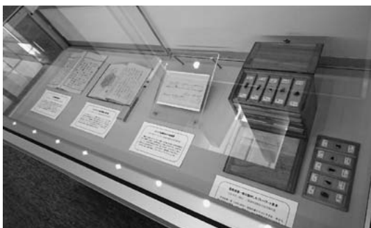
展示品（奈良坂源一郎のプレパラート見本など）