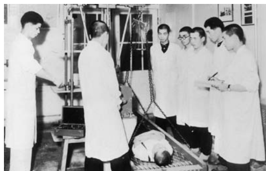
名帝大附属医学専門部の授業風景（展示パネルに掲載）