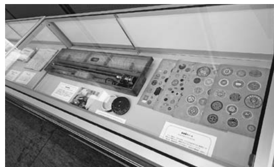
展示品（桐原式軟性胃鏡など）