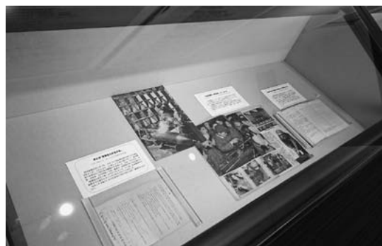
「銃後の諸相と結末」コーナーの一部