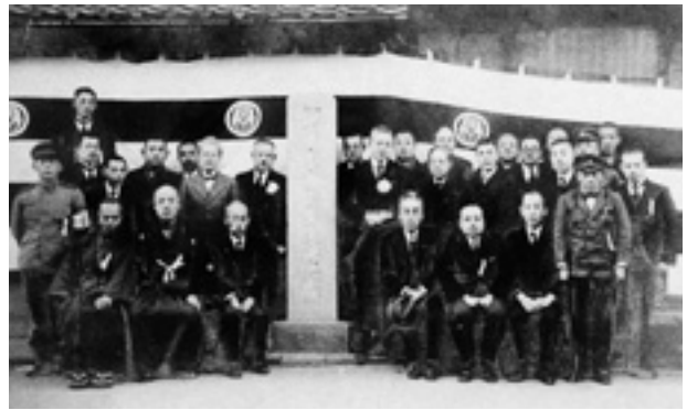
伊藤圭介先生生誕遺蹟碑建設記念写真 1939年

この2度の顕彰の両方に登場するのが、圭介生誕地の近くにある名城小学校（旧大成尋常高等小学校）と、