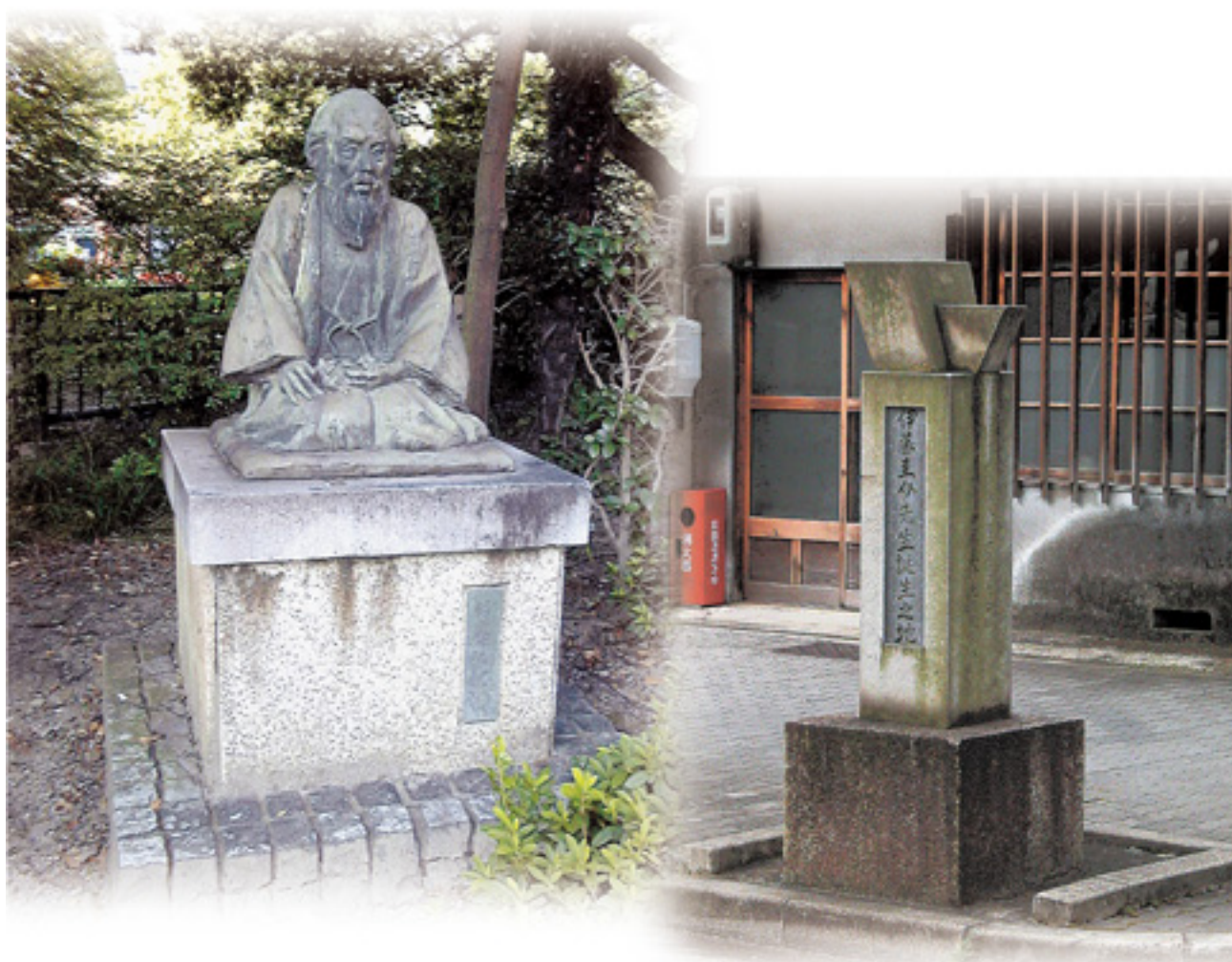
伊藤圭介座像(鶴舞公園)と「伊藤圭介先生誕生之地」碑(名古屋市中区)(本文3~5頁参照)