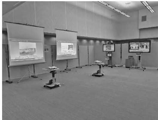
スライドショーコーナー