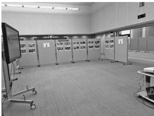
パネル展コーナー