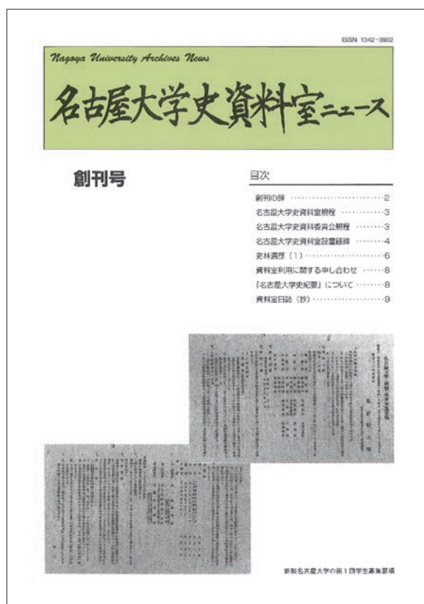
『名古屋大学史資料室ニュース』創刊号（1996年9月） （大学文書資料室のHPで閲覧可）