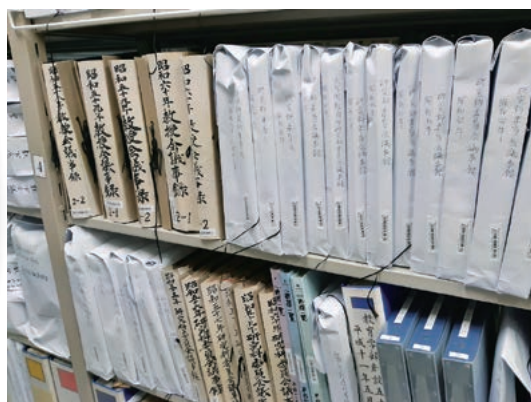
大学文書資料室資料保存庫の書架の様子

※ご寄贈資料は、東海国立大学機構大学文書資料室利用等規程などに基づいて、大切に保存・管理・活用させていただきます。とりわけ資料の公開につきましては、寄贈者の意向を優先しつつ、深甚の配慮をいたします。